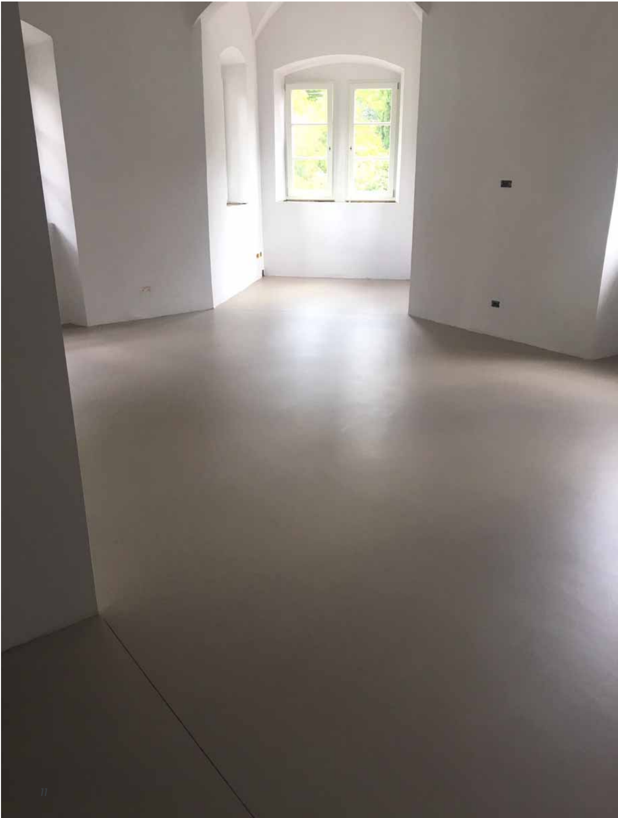
DOPO / AFTER