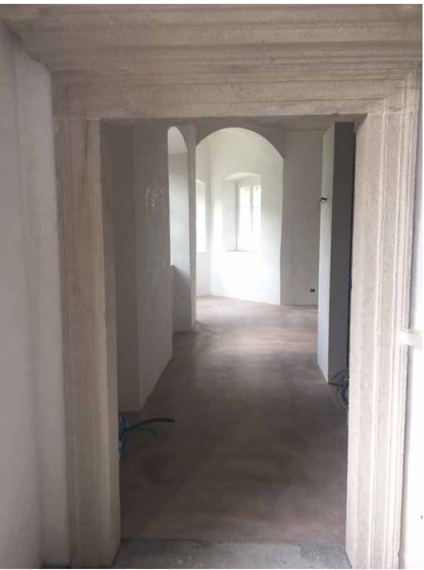
PRIMA / BEFORE